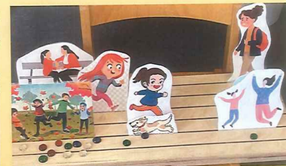
Aufstellung zu „Dreckig ist glücklich“ aus Machtgeschichten