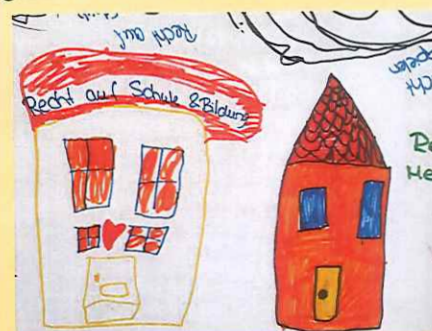
Recht auf Schule und Bildung